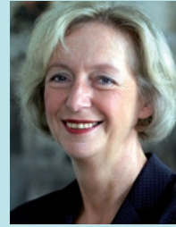
Prof. Dr. Johanna Wanka, Niedersächsische Ministerin für Wissenschaft und Kultur

Die Populärmusik ist Teil unseres alltäglichen Lebens. Stets kommt man mit ihr in Kontakt – sei es über das Radio oder ganz bewusst über CDs oder auf Konzerten. Um dem Genre Pop im Musikland Niedersachsen gute Rahmenbedingungen zu bieten, will das „PopMeeting“ Niedersachsen aktuelle Förderprogramme beraten und über die Ausbildungssituation junger Musiker diskutieren. Darüber hinaus bietet es ein Podium, um Ideen auszutauschen und Kontakte zu knüpfen.