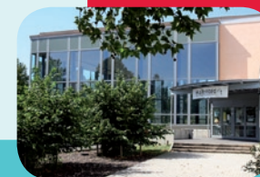
Hallenbad Wolfsburg - Kultur am Schlachtweg